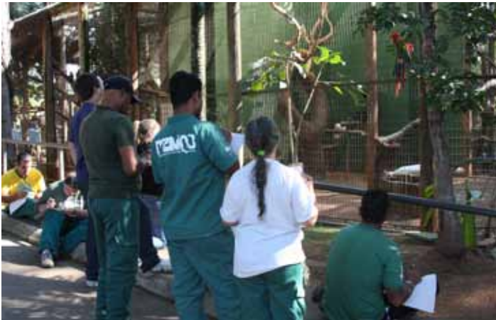
Funcionários do Zoológico Quinzinho de Barros, em Sorocaba, realizando o Etograma, sob supervisão da equipe de treinamento SHAPE-Brasil