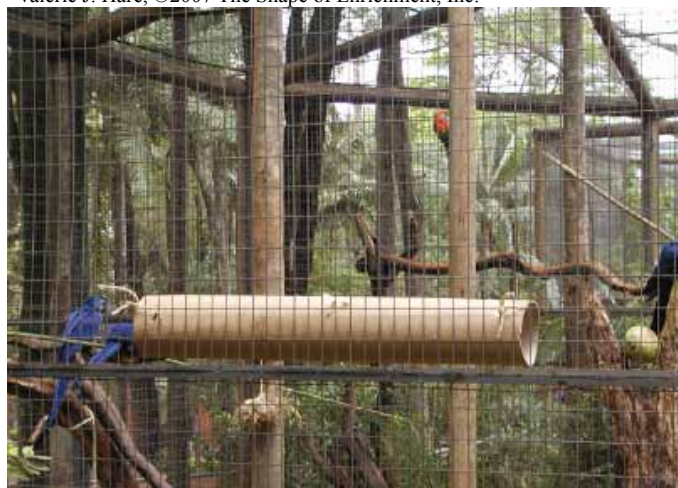
Tubos de carpetes de papelão foram uma ótima adição ao recinto das araras azuis. As araras andaram por cima e por dentro do tubo.