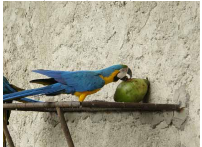
Os poleiros e os cocos receberam a maior, e imediata atenção. Esse colega nem esperou que saíssemos do recinto para pegar um coco.