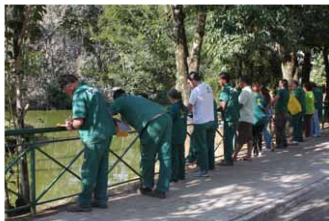
Equipe elaborando o etograma.

Toda a teoria oferecida foi resgatada no momento da prática. O mais surpreendente foi a capacidade e a criatividade dos participantes na criação dos itens de enriquecimento.