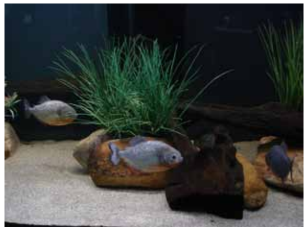
Piranhas-vermelhas ( Pygocentrus nattereri ) no Aquário de São Paulo

Ainda na fase de coleta de observações comportamentais antes do enriquecimento, verificamos que as piranhas apresentam o comportamento excessivo de canibalismo, assim como os cavalos-marinhos passam pouco tempo nadando e se alimentando. Com o enriquecimento, esperamos diminuir as agressões e aumentar a atividade natural desses animais.