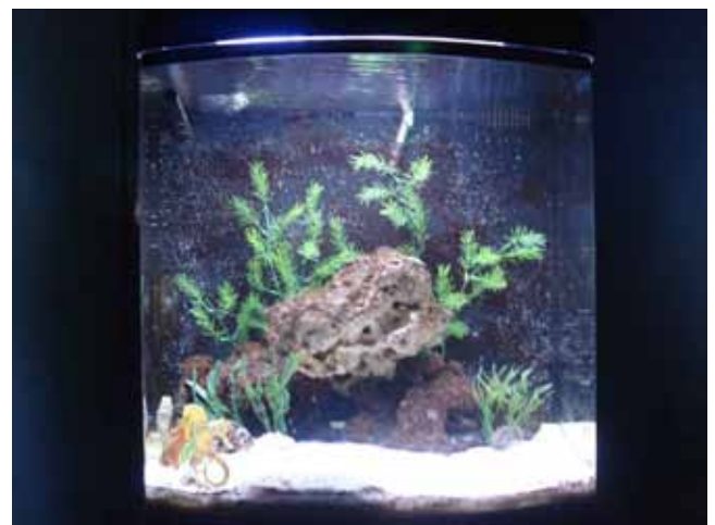
Cavalos-marinhos ( Hippocampus reidi ) no Aquário de São Paulo.

Com o SHAPE Brasil tivemos a oportunidade única de conhecer de perto a raposa-voadora ( Pteropus vampyrus ) do Aquário de São Paulo. Com a implantação do enriquecimento alguns animais passaram a explorar melhor o recinto, movendo-se para galhos antes pouco explorados. O condicionamento também trouxe muitos resultados positivos, inclusive foi observado um dos animais voando no recinto para participar da atividade, comportamento raramente observado em cativeiros pequenos.